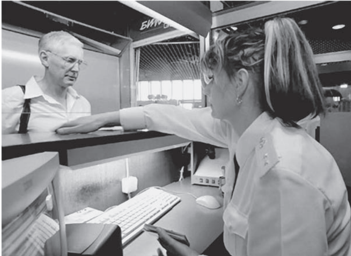
Тщательная проверка документов — защита от неприятности в пути