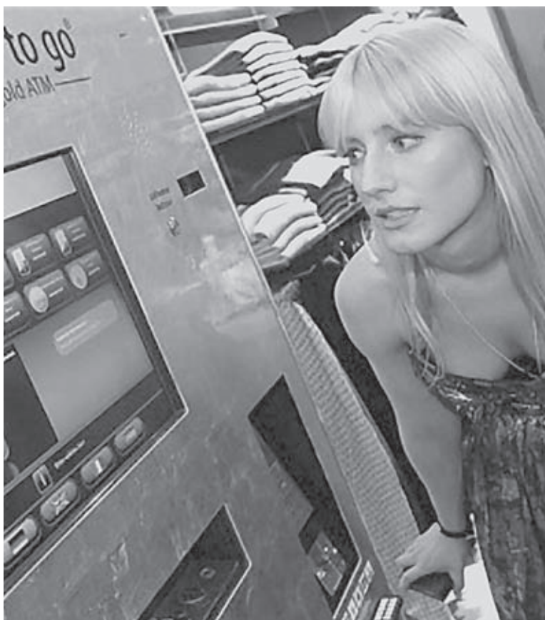
В Великобритании начал работу первый в стране автомат по продаже золота

Появилось желание покупать в кредит парковочные места для своих авто,