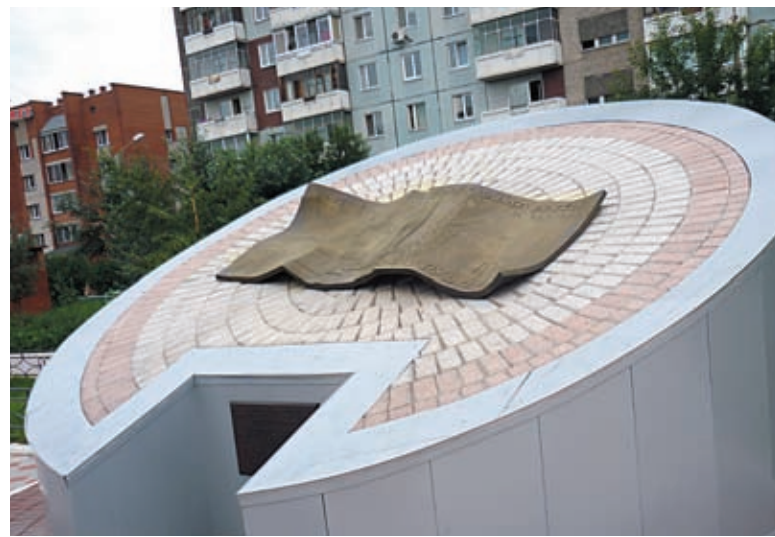
Памятник десятке установлен в Красноярске. Десятка, на которой изображены виды Красноярска — коммунальный мост, часовня Параскевы Пятницы и Красноярская ГЭС, считается одним из неофициальных символов города.